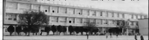
愛知県高浜市立 吉浜小学校